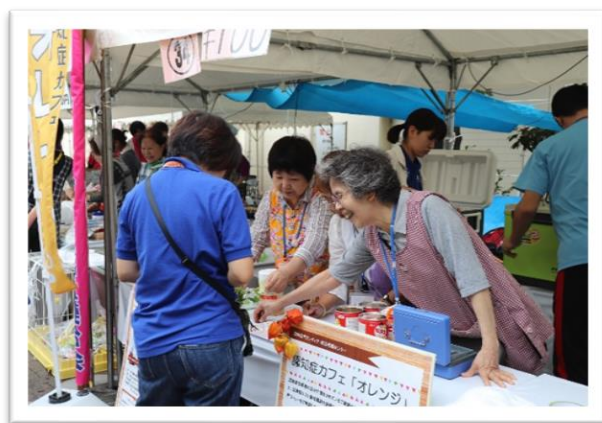
認知症カフェ「オレンジ」でアイスコーヒーを販売

当日は不安定なお天気でしたが、淀川区民まつりに参加することができました。ボランティア登録団体のおおさか・よどがわ・おもちゃ病院と認知症カフェ「オレンジ」、個人ボランティア、大阪保健福祉専門学校の学生ボランティアに支えられ、どのブースも区民の方に喜んでいただきました。