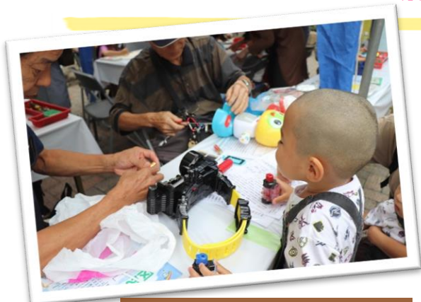
壊れたおもちゃは直るかな・・・