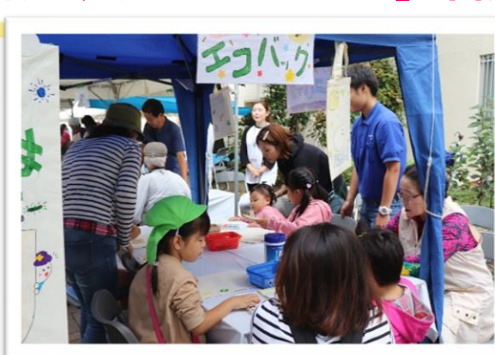
布描きクレヨンで世界に一つだけのエコバックづくり♪